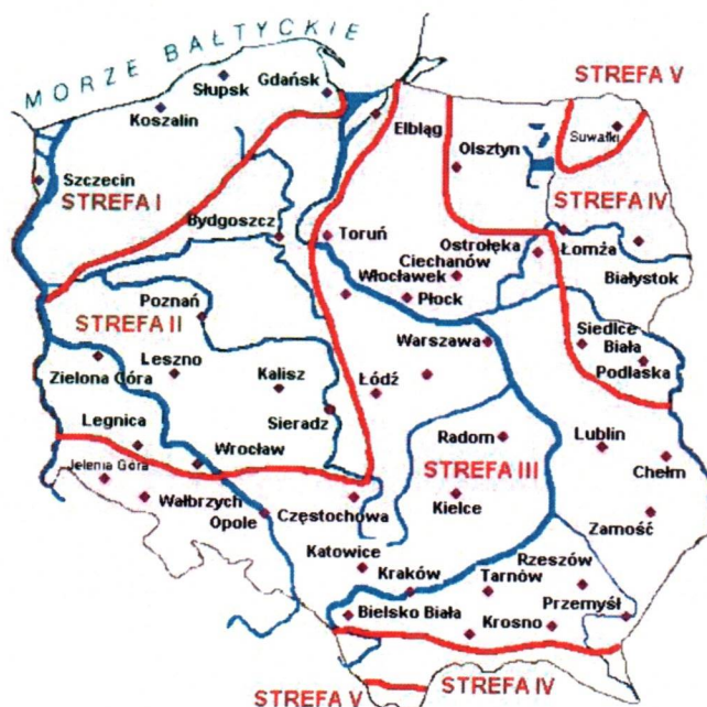
Rys. 1 Strefy klimatyczne Polski i temperatury obliczeniowe

Położenie obiektu, w którym planowany jest montaż, na mapie ma wpływ na pracę instalacji. W zależności od współrzędnych geograficznych rozbieżności w temperaturach projektowych mogą mieć znaczącą wartość. W skali kraju ilustruje to poniższa mapa (Rys.1).